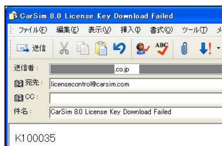
図 3 を参考に Your Key ID number 欄（例：K100035）を電子メールでメカニカルシミュレーションへお知らせ下さい。（コピーペーストする場合、右クリックが使えませんが Ctrl + c でコピーします）

オンラインアップデートが出来ない場合、電子メールにより新たなライセンスファイルを取得する事ができます。前項のオンラインアップデートと同様の方法で License Utility を起動し Renew ボタンをクリックして License File Renewal 画面（図 2）を表示します。