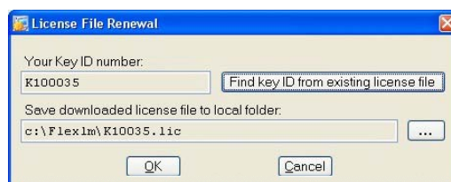
図 2 License File Renewal 画面

License Utility 画面にて Renew ボタンをクリックし License File Renewal 画面 ( 図 2 ) を表示させます。Your Key ID number 欄に取り付けられた dongルキーの Key ID が表示されますので確認してください。